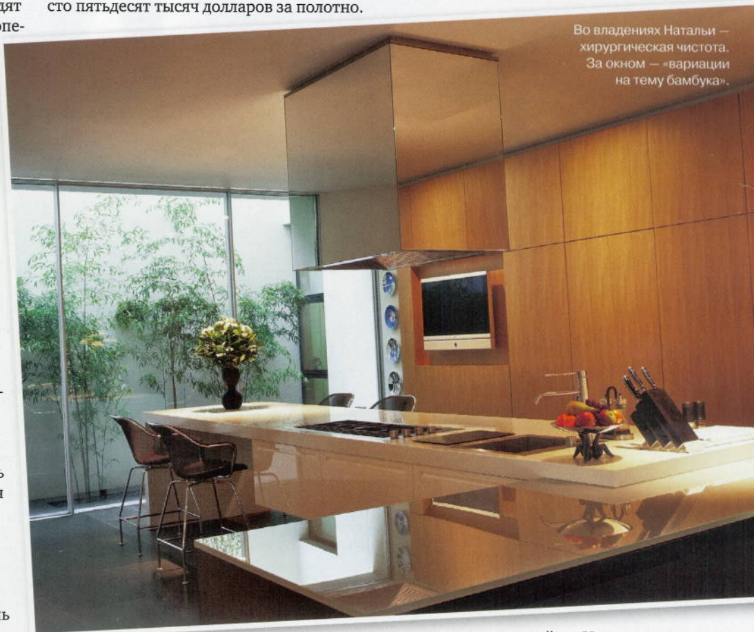
Во владениях Натальи — хирургическая чистота. За окном — «вариации на тему бамбука».

«Вы понимаете, мы самые обыкновенные люди, — подытоживает Наталья. — У нас нет сумасшедших денег. Этот дом мы купили, взяв ипотечный кредит. То, что мы тратим на коллекцию и другие программы, — это существенная сум-